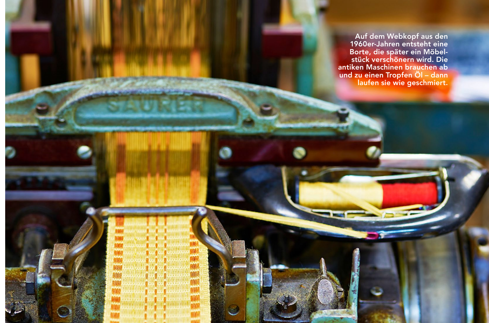
Auf dem Webkopf aus den 1960er-Jahren entsteht eine Borte, die später ein Möbelstück verschönern wird. Die antiken Maschinen brauchen ab und zu einen Tropfen Öl – dann laufen sie wie geschmiert.