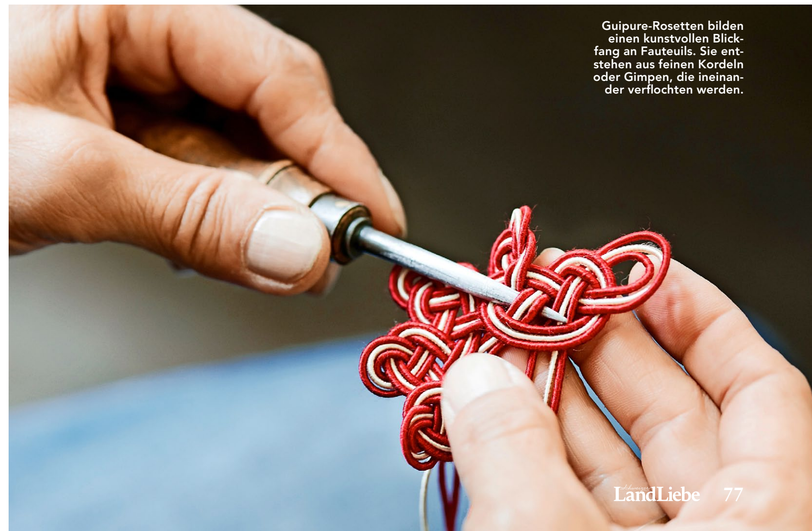
Guipure-Rosetten bilden einen kunstvollen Blickfang an Fauteuils. Sie entstehen aus feinen Kordeln oder Gimpfen, die ineinander verflochten werden.