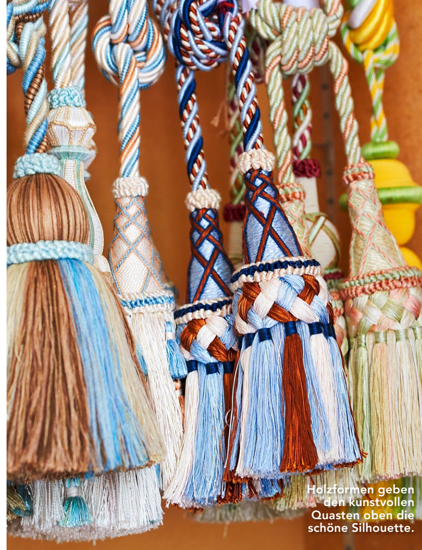
Holzformen geben den kunstvollen Quasten oben die schöne Silhouette.